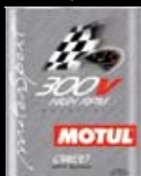
Presentación Código 2lt 101179

En la competición, el objetivo es conseguir las máximas prestaciones dependiendo del motor, del tipo de carrera y de la duración de la misma. Los 6 diferentes grados de viscosidad de la Gama 300V permiten una solución precisa para cada tipo de motor y carrera, consiguiendo unos resultados óptimos. La viscosidad 0W20 está destinada a los motores diseñados para utilizar lubricantes de baja viscosidad