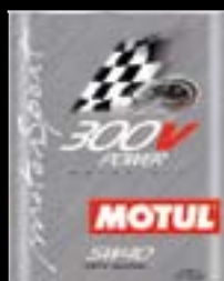
Presentación Código 2lt 101195