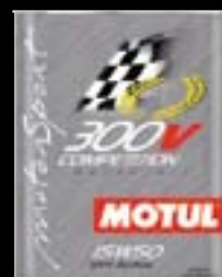
Presentación Código 2lt 101202