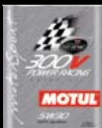
Presentación Código 2lt 101189