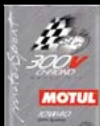
Presentación Código 2lt 101216